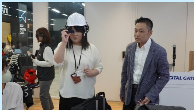
遠隔作業支援の体験