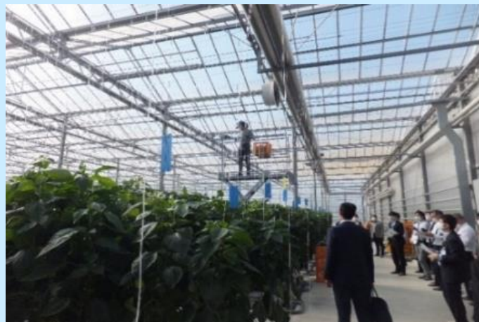
（株）南国スタイルの次世代型ハウス視察風景