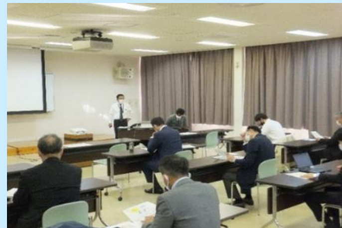
高知県農業技術センターでの説明の様子