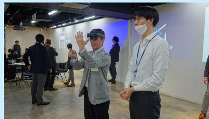
デジタル空間で再現された製品映像の体験