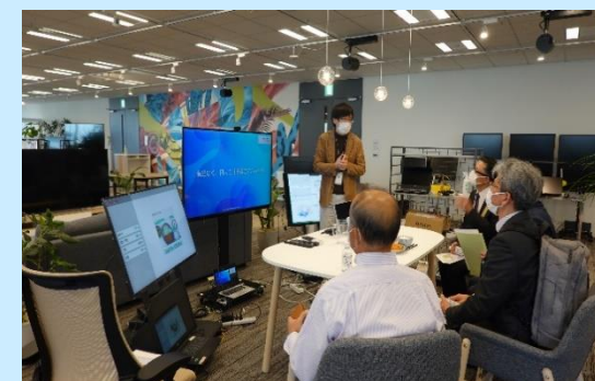
KDDI research atelierでの視察風景

KDDI(株)が2018年9月に開設した、デジタルを活用した新規ビジネスや業務改革の具体化をサポートする施設。