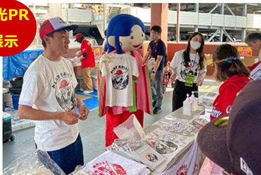
観光・グルメ等のパンフ配布、パネル展示