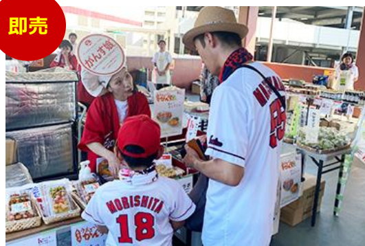
特産品の販売・グッズ販売