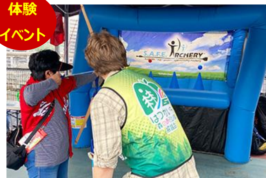
わがまちの体験をイベントで再現